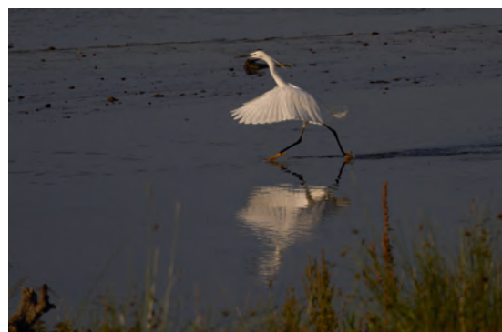
Baarsemwaard – kleine zilverreiger rent achter prooi aan (6 juli 2015)