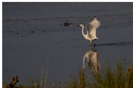
Baarsemwaard – kleine zilverreiger versnelt het foerageren (6 juli 2015)