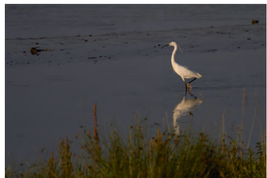
Baarsemwaard – kleine zilverreiger waadt langzaam door de lagune (6 juli 2015)